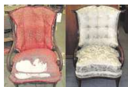
Aus alt mach neu