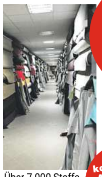
Über 7.000 Stoffe

Zu Ihrer und unserer Sicherheit während der Corona-Situation werden wir natürlich in entsprechender Schutzkleidung kostenlos und unverbindlich zu Ihnen kommen.